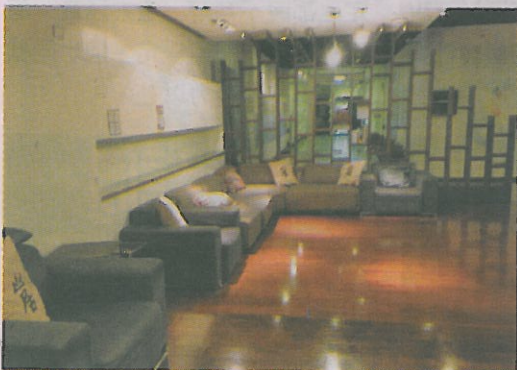
▲政大山居學習中心讀書室。

最大住宿式學院」的澳門大學更不用說，橫琴新校區8棟宿舍樓仿自英美書院四合院形式，每棟宿舍樓一樓是飯堂、討論室、健身房等；每層樓有廚房、交誼廳；房間是兩人一間，兩房之間共用一個衛浴設備，既方便交流又不影響隱私。