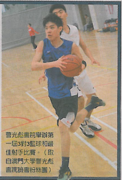
曹光彪書院舉辦第一屆3對3籃球和最佳射手比賽。

香港中文大學各書院有大一通識課，通常是討論上大學的意義。部分書院如崇基和聯合會要求學生在畢業年做一個小組專題研究及討論計畫(final year project)。