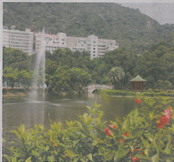
▲香港中文大學崇基書院校園內的未圓湖與崇基禮拜堂。

也有不少台校書院工作人員表示，經費不見得是制約一切的因素，主要還是看學校政策，「學校支持，經費就可商量。」不少台校書院也開始討論讓書院生「使用者付費」。(系列八之四)