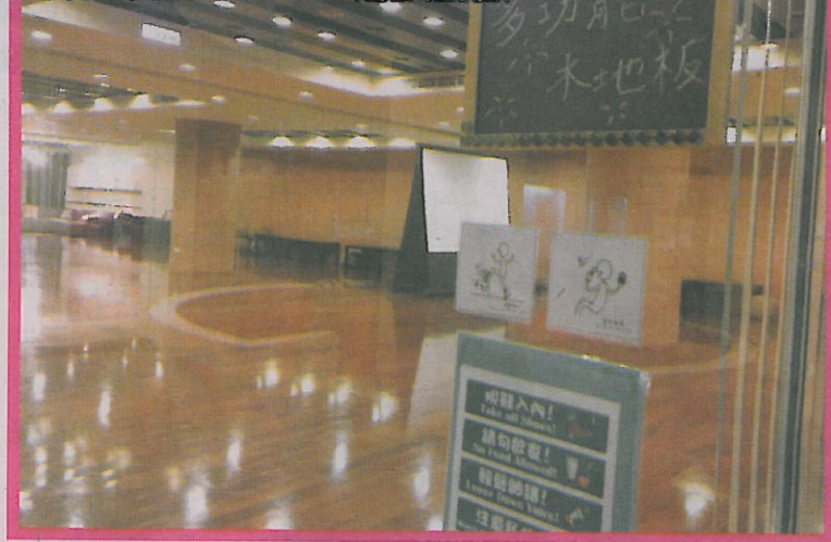
木地板是台校書院必備元素 圖為政大山居學習中心多功能教室

、博雅書房、創意學習基地、舜文大講堂，用水岸電梯連結河畔與藝文中心等，讓女生也可安心入住。