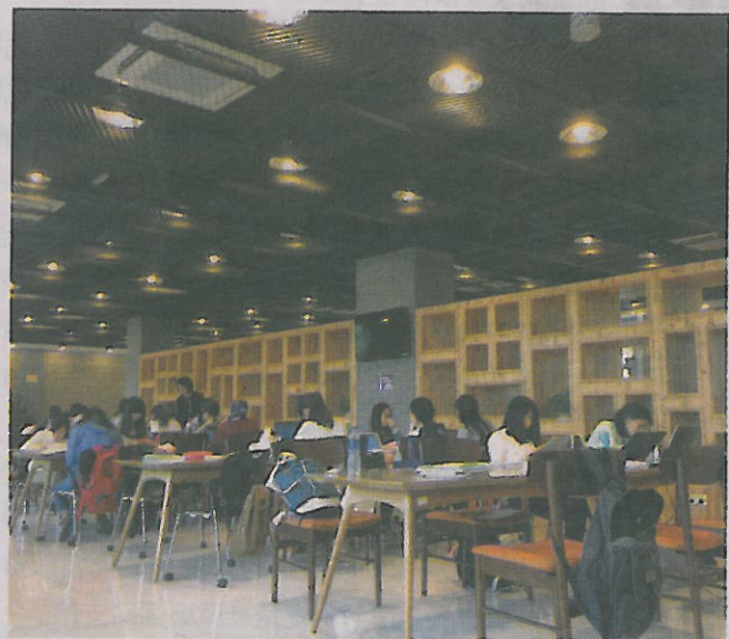
▲華東師範大學孟憲承書院學生共享中心。

2010學年起，清大學生自治團體主動出擊，在原有的齋長自治團體之下舉辦《齋報》、齋民大會等。另由於清華大學規定，大三之後若要續住宿舍要通過留宿資格審查，目前清華載物書院是由留宿委員會執行，院生表示留宿委員會可說是載物第一個完整的院生自治組織，真正做到「院生留宿，院生審」。